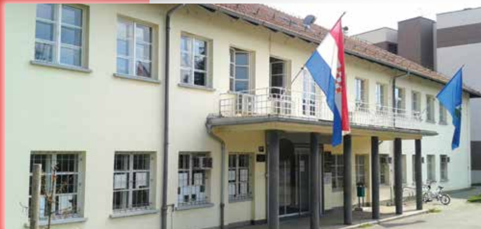
Petrova 116, Zagreb

koji je bio usmjeren na prevenciju invalidnosti, profesionalnu rehabilitaciju i zapošljavanje invalida rada, dok je odlazak u invalidsku mirovinu bila krajnja mjera. No, praksa je bila drugačija. Povećavao se broj invalida rada i povećavali su se problemi njihova zapošljavanja odnosno rastao je broj nezaposlenih invalida rada. U takvim se uvjetima kod invalida rada javila potreba za osnivanjem organizacije koja bi ih zastupala i predlagala sustavna rješenja problema s kojima su se susretali na radu i u životu općenito.