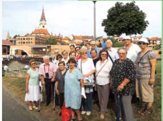
Hodočašće u Mariju Bistricu

Cilj Saveza bio je unapređenje gospodarskog, socijalnog i pravnog položaja osoba s invaliditetom za čije je ostvarivanje obavljao sljedeće djelatnosti: