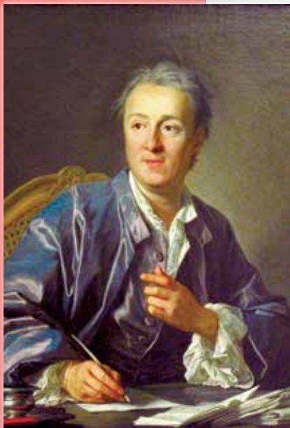
Denis Diderot, 1767. godina

U razdoblju od sredine 14. do početka 16. stoljeća humanizam i renesansa usmjeravali su pažnju na čovjeka i na njegove ovozemaljske potrebe, pa su i osobe s invaliditetom, iako postupno, postale sve više predmetom interesa, ponajprije istaknutih pojedinaca, a zatim i društva. U tom pogledu, posebno mjesto pripada materijalistima 18. stoljeća među kojima se najviše istaknuo Denis Diderot (1713-1784.), francuski filozof, umjetnički kritičar i književnik. Njegova pisma "Pismo o slijepima" iz 1749. godine, namijenjeno onima koji vide i "Pismo o gluhima i nijemima" iz 1751. godine, namijenjeno onima koji čuju i govore, predstavila su ga svijetu kao izvornog mislioca. Predmet tih pisama bile su rasprave o korelaciji ljudskog razuma i znanja stečenih percepcijom, a